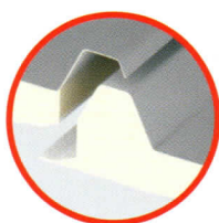
Detalle de solape